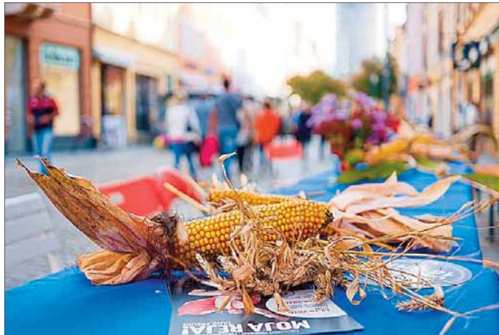
Platz nehmen und die Gemütlichkeit der goldenen Jahreszeit genießen. Die liebevoll dekorierte Tafel auf der Reichenstraße wird zum Hingucker auf der Reichenstraße.

Zu den begehrtesten Sitznachbarn an Bautzens größtem Tisch dürften die Teilnehmer des Grill-Contests gehören. Im Rahmen des Herbstfestes kann jeder, der seine Fähigkeiten am Rost während des Sommers perfektioniert hat, sein Können unter Beweis stellen. Dazu stellen die Teilnehmer des Wettbewerbes den Besuchern ihr Grillgut unent-