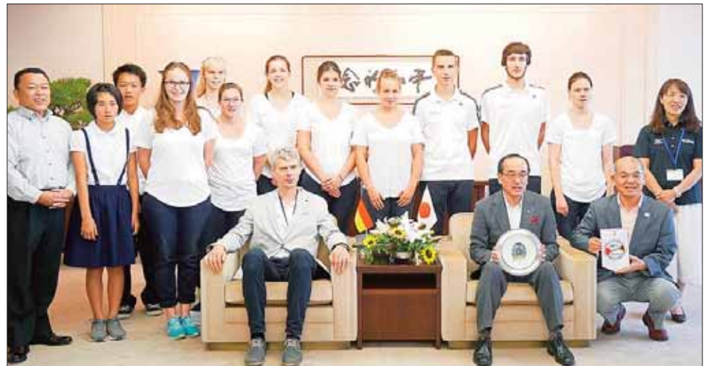
Im Rahmen des 44. Simultanaustausches der deutschen und japanischen Sportjugend reisten auch 4 Bautzener Jugendliche nach Japan. Als eines von vielen Erlebnissen bleibt ihnen der Aufenthalt in Hiroshima inklusive Empfang beim Bürgermeister im Gedächtnis. Im Vordergrund der Reise standen das Kennenlernen der Lebensweise in Japan sowie der Gedankenaustausch unter den Jugendlichen.