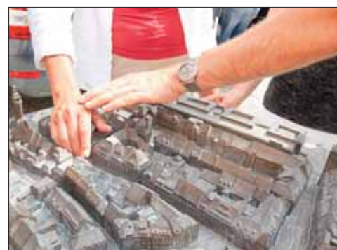
Selbst Details wie Fenster oder Brunnen können auf dem Modell ertastet werden.