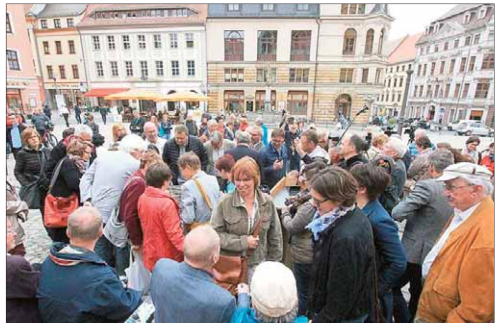
Kaum zu erkennen. Bei der feierlichen Enthüllung des Blindenstadtmodells war der Andrang so groß, dass dieses Foto einem Suchbild gleicht. Für den dreidimensionalen Stadtplan wurde direkt vor der Tourist-Information auf dem Hauptmarkt ein repräsentativer Ort gefunden.

haben. So setzten sich Vertreter des Blinden- und Sehbehindertenverbandes engagiert für das Projekt ein. Entscheidend wurde das Vorhaben auch durch das Zusammenwirken der Ämter der Stadt Bautzen und der Tourist-Information Bautzen-Budyšin vorangetrieben.